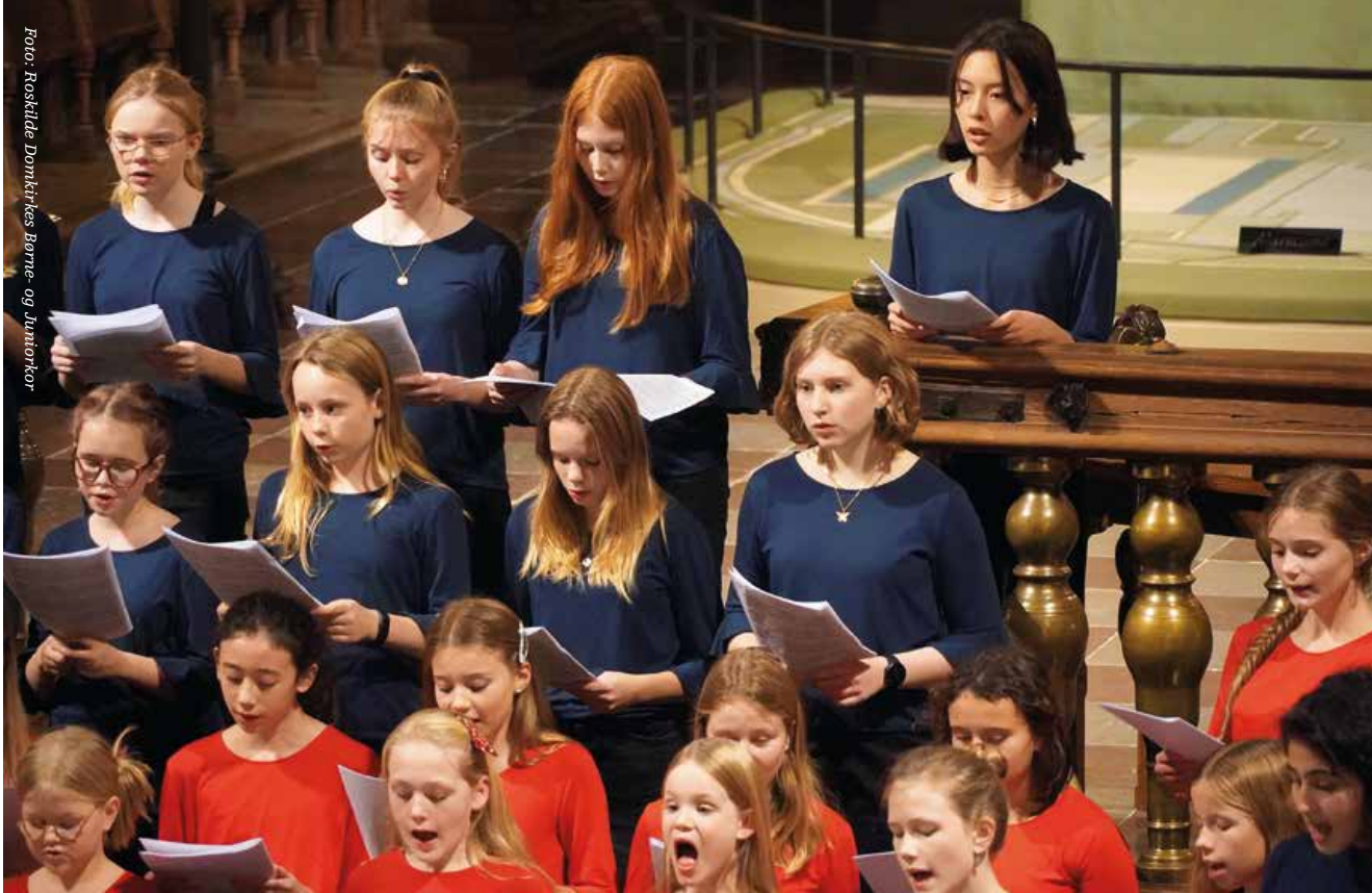
Mange børn kender lidt eller intet til Bibelen og kun ganske lidt til kirke eller gudstjeneste. Her udgør børne- og ungdomskorarbejdet en hjørnesteen inden for den kirkelige undervisning. Gennem korene får børnene en fortrolighed med kirken og dens gudstjenester.