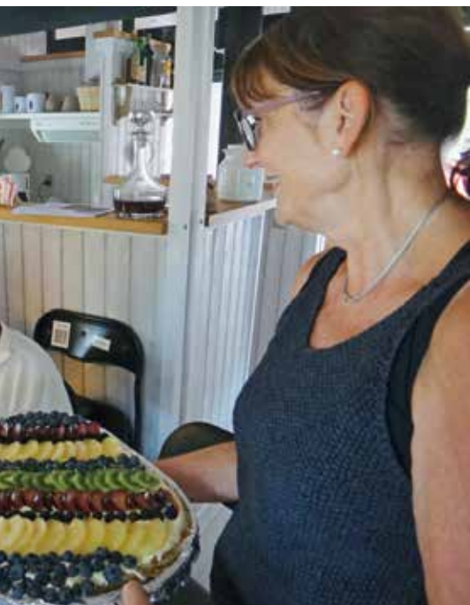
De frivillige i Aalborg Aflastnings- og Vågetjeneste har et samarbejde med demensteam Vestbyen om en café for mennesker med en demenssygdom.

samarbejde med demensteam Vestbyen om en café for mennesker med en demenssygdom. De frivillige i Aalborg Aflastnings- og Vågetjeneste havde i forvejen en stor viden om og erfaring med kommunikation med demente. Demensteamet fandt et aktivitetscenter, hvor vi kunne være. Vi har åbent onsdag fra kl. 13-16 året rundt. Vi har omkring 10 gæster og 4 frivillige og 1 ansat. Enten er demenskoordinatoren eller jeg med i Caféen. Det er rart at være frivillig i Caféen, og det er rart at være gæst. Og sådan skal det også gerne være. En win-win situation!