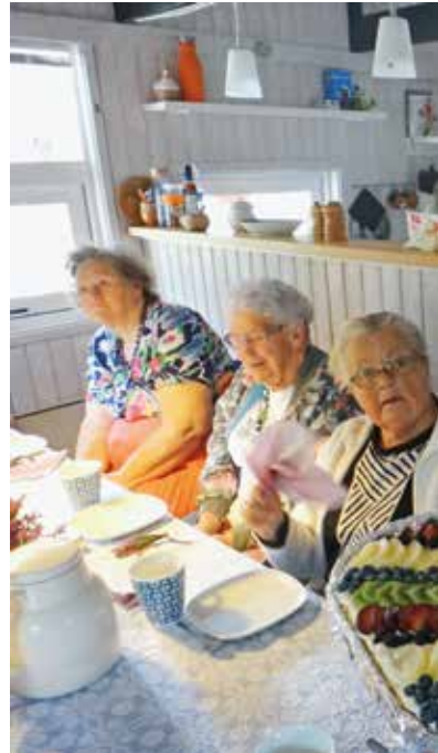
Frivilligmarked i Aalborg.