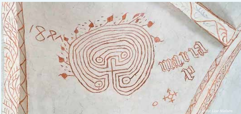
Labyrinten på Hesselager Kirkes hvælv.

I hvilken udstrækning labyrinter har været brugt i kirkens daglige kontemplative liv, ved man imidlertid