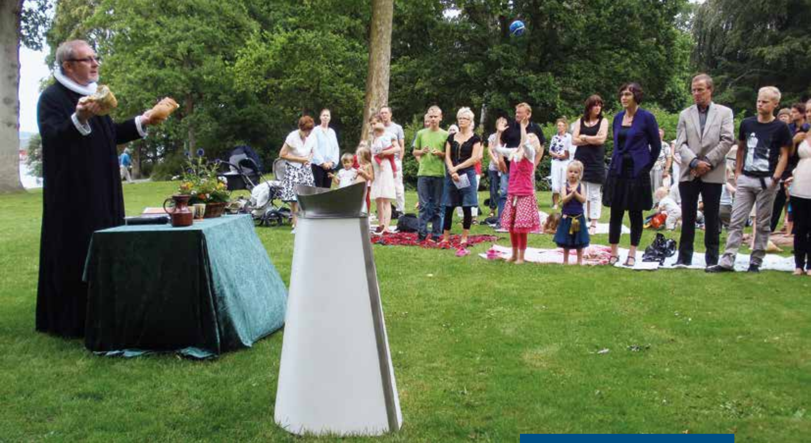
Billede fra et af de årlige middelaldermarkeder i Holbæk, hvor kirken blev bedt om at holde en middelaldermesse i Strandparken blandt de forskellige middelalderaktiviteter.

dørs i haller) – virkede det for mig i den grad oplagt at afholde en "Street Paradedgudstjeneste": en gudstjeneste i byens rum, hvor vi gik gennem byens strøg med et gående jazzband og med fire stop undervejs, hvor de to præster på skift holdt en miniprædiken, inden vi sang en salme og gik videre – og hvor vi ved vejs ende lyste velsignelsen, inden man gik hver til sit i det myldrende byliv. Vi prøvede det samme, da vi ville markere, at kirken også var til stede i Nordhavn med en pinsegudstje-