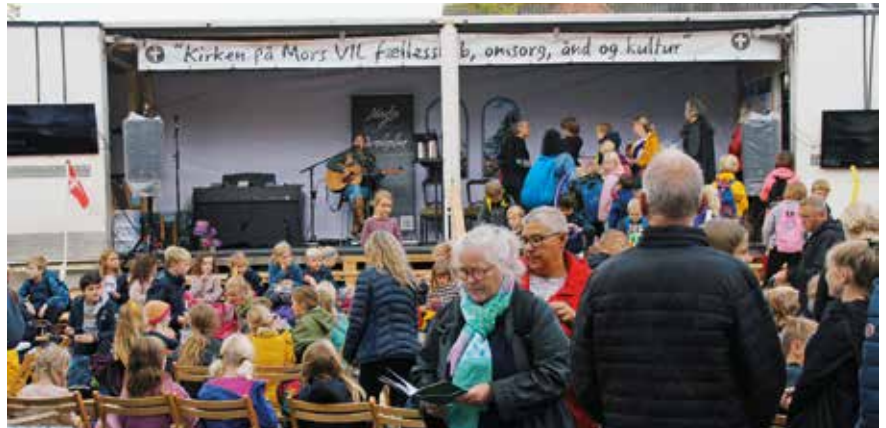
En stor køletrailer samt 210 europaller udgjorde "Kirkebussen" i 2019 og blev indrettet som scene. Kirkebussen havde et stort program med foredrag, diskussion, sang, børneaktiviteter og meget mere.

Kirkebussen flyttede af tekniske grunde ind på Nykøbing Mors gågade og blev dermed et bindeled mellem Kulturområdet og selve byen. Andre aktører på Kulturmødet var også at finde på gågaden.