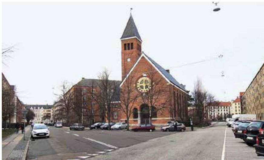
Kirkepladsen foran Mariendal Kirke, som den så ud før og efter renoveringen i 2018.

hold for gangbesværede til kirkebygningen. Herudover skulle pladsen være indrettet til ophold med siddepladser på bænke, og der skulle være et grønt islæt med træer og beplantninger.