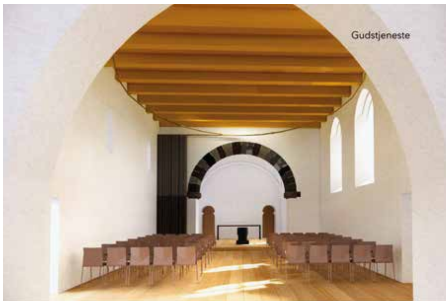
Her ses projekttegninger for, hvordan gudstjenesterummet i den ene ende af kirken vil komme til at se ud, og hvordan der vil være plads til babysalmesang og meget andet i den anden ende af kirken. Kirkerummet vil altså kunne indrettes fleksibelt, også ved hjælp af et stort scenetæppe. Tegninger: Mejeriet