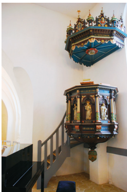
Prædikestolen er blevet flyttet ud i højre hjørne af skibet, så alle nu kan se ind i koret.