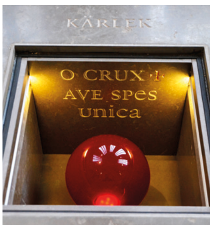
Siden 2015 har en stor Kristuskrans været nedlagt i Linköping Domkyrkas gulv. Den er 180 meter lang, og vandringslangs den har navnet ”Via Sacra”.