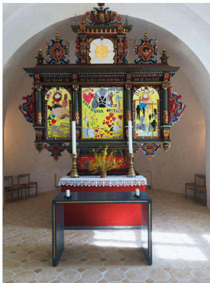
Altertavlen blev trukket frem foran den sidste bue i koret, og præsten fik et lille alterbord foran tavlen, således at hun står med front mod menigheden under gudstjenesten.

Ingen behøver heller ikke i dag snuble over det lille trin mellem skib og kor, og derfor har de gangbesværede fået meget lettere ved at komme til nadver, og koret og musikere kan meget mere frit placere sig ved koncerter.