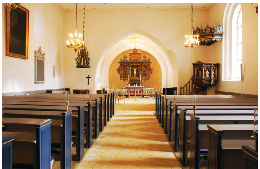
Mange fik fornemmelsen af, at kirkerummet var blevet bredere og længere, da de kom ind i den for første gang efter restaureringen.

Men jo. Det kan man faktisk godt sige, for i bund og grund var det hele tiden ønsket, da vi i 2015 lukkede kirken i et år for at restaurere den indvendigt. Den skulle både være mere brugervenlig, og den skulle give en følelse af mere fællesskab og samhørighed. Vi begyndte ikke med at tale om enkeltheder. I stedet talte vi først om, hvilket gudstjenesteliv – og liv i det hele taget – vi havde og gerne ville have. Var der noget i kirkerummet, der vanskeliggjorde det? Og hvad kunne der gøres for at fremme det?