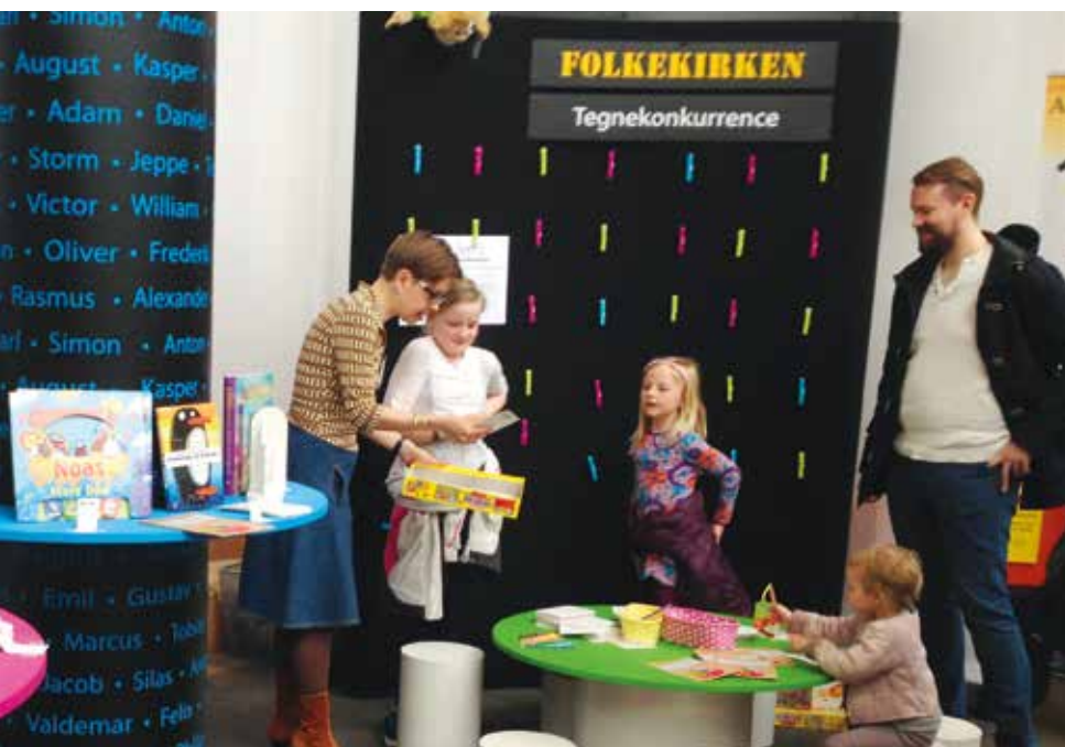
Siden 2012 har folkekirken været repræsenteret på Baby- og Småbørnsmessen i Øksnehallen på Vesterbro. Folk får hurtigt øje på de to søjler med drenge- og pigenavne, når de passerer folkekirkens stand, og de fleste stopper op og får en snak med én af præsterne.

Udgangspunktet for deltagelsen på messen er, at kirken skal være der, hvor folk er, og med det faldende dåbstal ser vi en enorm styrke i at rykke ud og være synlige. De samtaler, der finder sted er meget meningsfulde, og de besøgende giver udtryk for, hvor rart det er for dem at møde en nærværende kirke. Der er en tegnekonkurrence for børn med boggaver fra RPC og Bibelselskabet, og mens børnene tegner, taler vi med forældrene om deres forhold til kirke og tro. Vi er ikke i tvivl om, at kirkens tilstedeværelse her er med til at rykke ved opfattelsen af kirken og dåben som en vigtig ting at give barnet. Folkekirken får uformelt lagt sit ”visitkort” til videre bearbejdelse hos de mange besøgende. ■