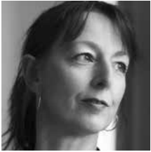
Iben Krogsdal Forfatter og salmedigter