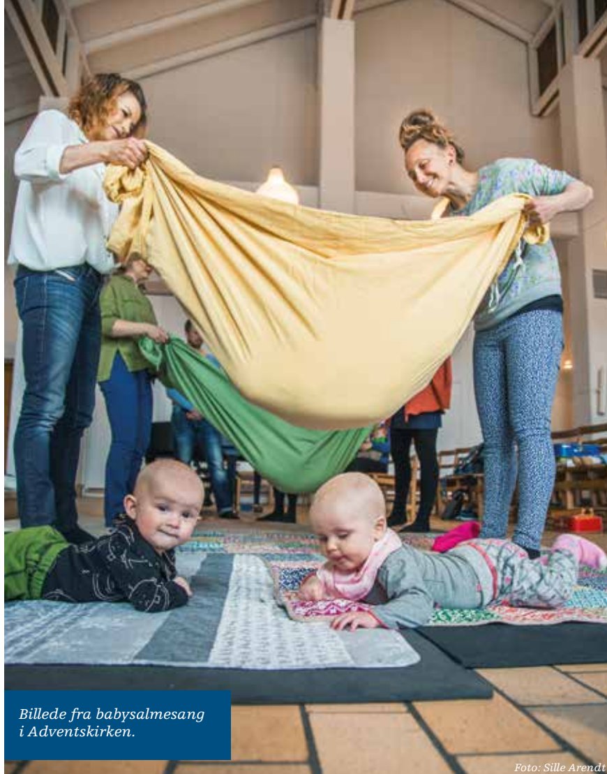
Billede fra babysalmesang i Adventskirken.