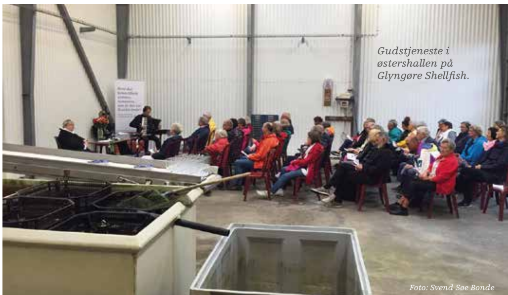
Gudstjeneste i østershallen på Glyngøre Shellfish.

en festival på havnen. Men vi gav ikke op. Menighedsrådet begyndte at tænke på alternative steder at holde vores gudstjeneste. Og så pludselig en dag blev en dør smækket op på vid gab og vi blev budt indenfor. Den lokale