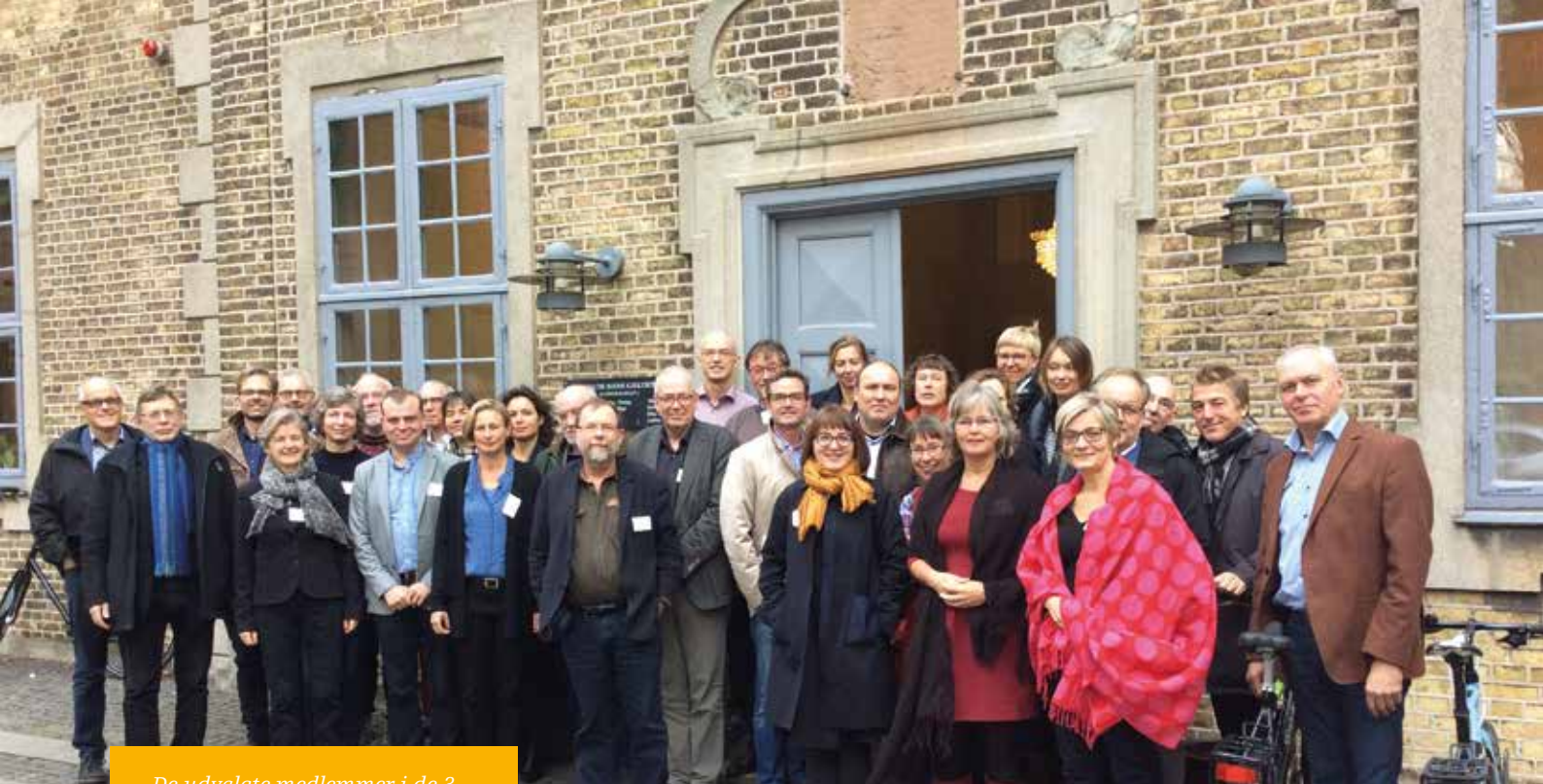
De udvalgte medlemmer i de 3 arbejdsudvalg, der skal arbejde med fremtidens gudstjeneste.

må vi følge den almindelige kulturelle udvikling om at have ”flere bud på hylderne” og kunne imødekomme flere forskellige behov, det være sig gudstjenestetidspunkt og -form. En spørgen efter fleksibilitet kalder også spørgsmål frem som: Hvis er gudstjenesten? Er det demokratiet eller teologisk faglighed (f.eks. idéen om det særligt lutherske), der skal styre processen i en reform? Hvor meget af en gudstjenesteorden skal fastlægges (dvs. autoriseres), og hvor meget skal frigives til menighedens og præstens tilrettelæggelse?