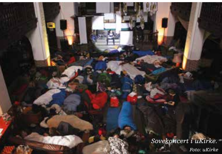
Sovekoncert i uKirke.

Det er tydeligt for os, at behovet og viljen til at høre, hvad en præst har at sige om Gud, Jesus og Helligånden er stort, vi skal bare turde at give lidt eller i andre møder meget slip på hvordan. Sidst men ikke mindst så skal vi turde lave fejl, måske endda mange fejl, for det er af de fejl, vi kan udvikle os, og hvis vi er heldige, så laver vi kun den samme fejl en gang. ■