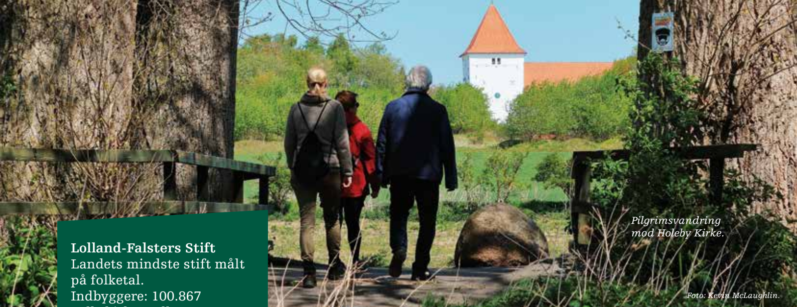
Pilgrimsvandring mod Holeby Kirke.