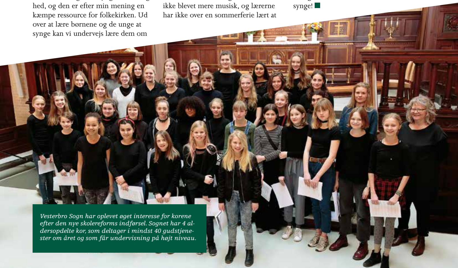
Vesterbro Sogn har oplevet øget interesse for korene efter den nye skolereforms indførelse. Sognet har 4 aldersopdelte kor, som deltager i mindst 40 gudstjenester om året og som får undervisning på højt niveau.

Lad os glæde os over, at vi har fået mulighed for at lære Danmarks børn at synge! ■