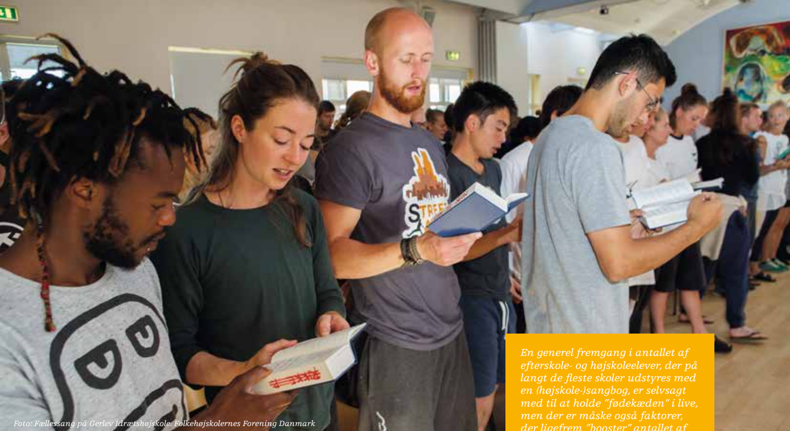
Foto: Fællessang på Gerlev Idrætshøjskole. Folkehøjskolernes Forening Danmark

En generel fremgang i antallet af efterskole- og højskoleelever, der på langt de fleste skoler understøttes med en (højskole-)sangbog, er selvsagt med til at holde "fødekæden" i live, men der er måske også faktorer, der ligefrem "booster" antallet af fællessangere rundt omkring i det ganske land.